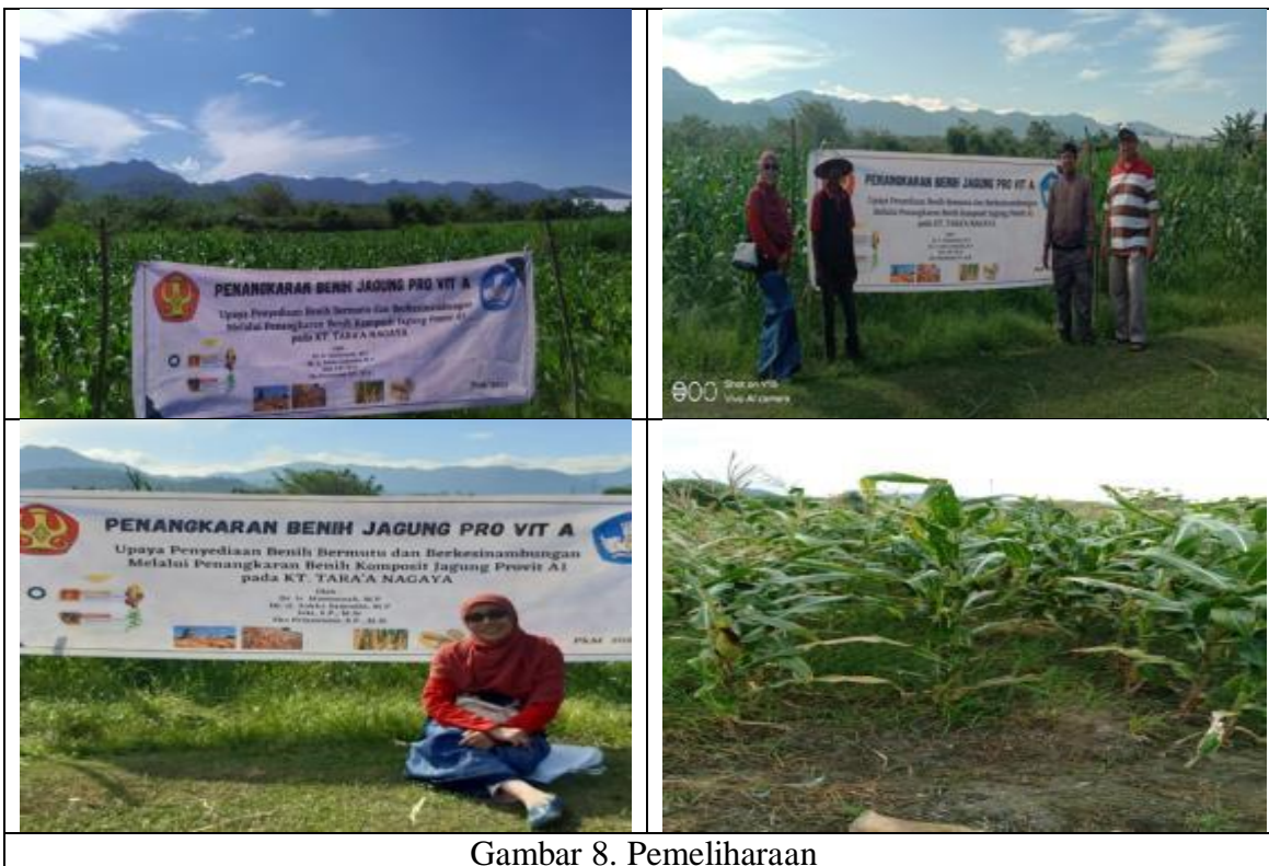
Gambar 8. Pemeliharaan

barisan bunga betina dan satu barisan bunga jantan.