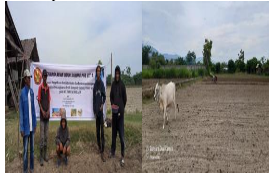
Gambar 4. Persiapan Lahan

Pengolahan lahan dilakukan satu minggu sebelum tanam, dengan menggunakan ternak sapi dan dilanjutkan dengan pembuatan bedengan menggunakan traktor tangan.