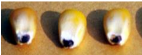
Gambar 3. Black Layer