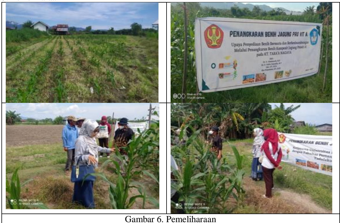
Gambar 6. Pemeliharaan