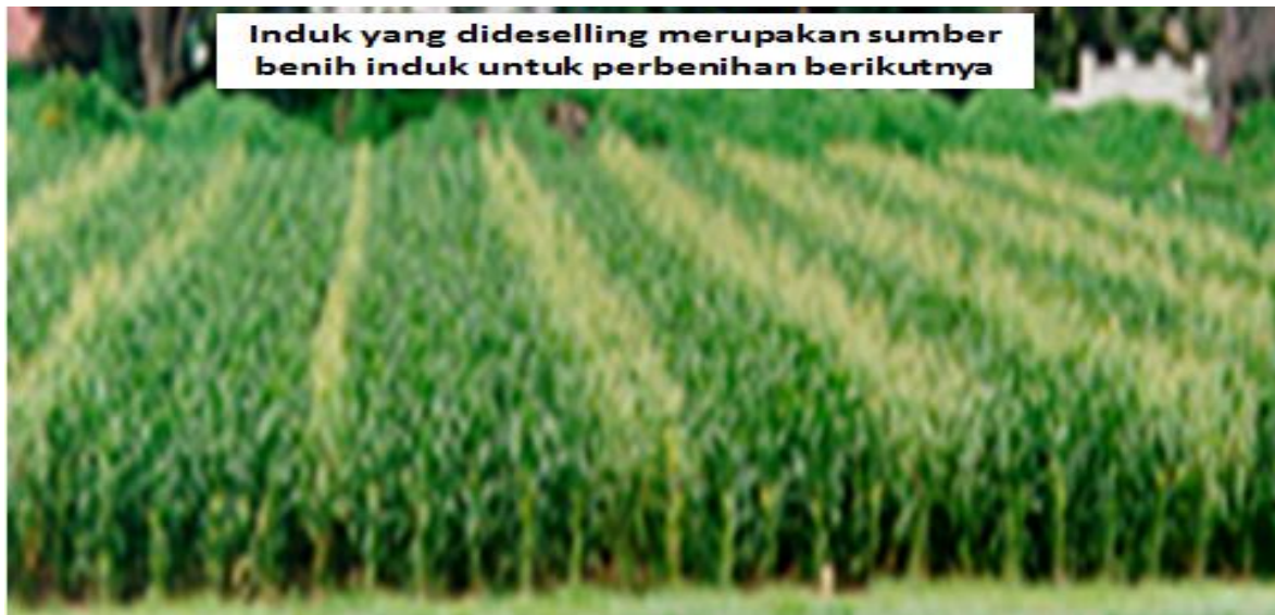
Gambar 2. Petanaman dalam barisan 4 : 1