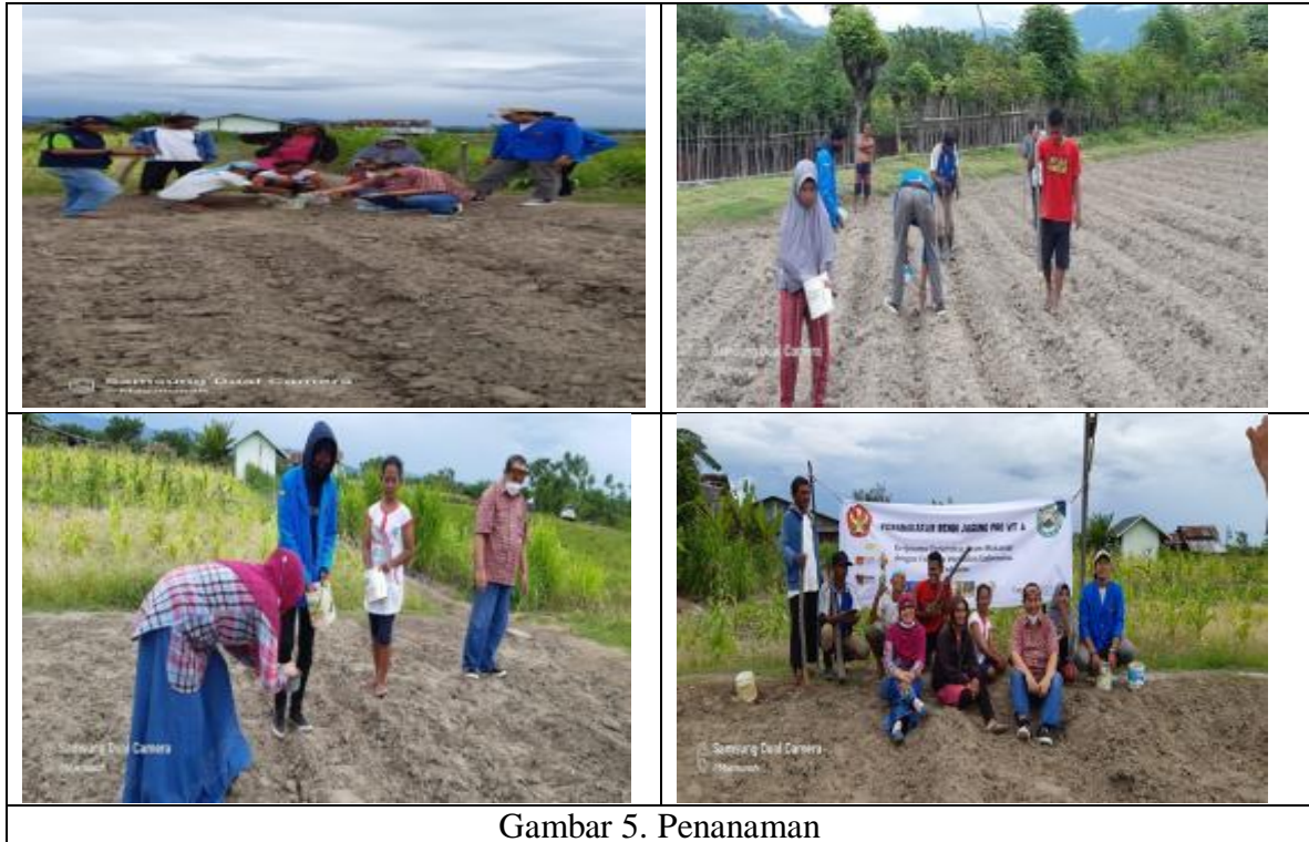
Gambar 5. Penanaman

Penanaman dilakukan sore hari dimana benih yang ditanam telah diberi ridhomil dan direndam selama \pm 6 jam.