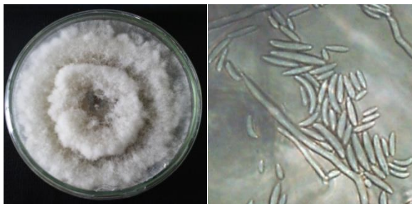
Gambar 1. a) bentuk dan warna koloni C. capsici , b). Bentuk konidia C. capsici

Berdasarkan hasil identifikasi terhadap penyakit antraknosa, patogen penyebab antraknosa pada cabai rawit adalah C. capsici .