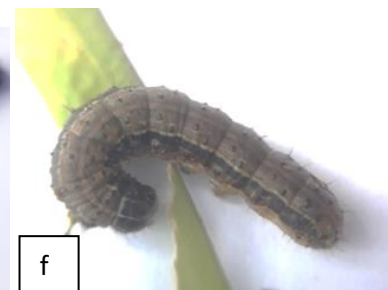
Gambar 2. Perbedaan setiap stadia larva (a) instar 1 (20X), (b) instar 2 (20X), (c) instar 3 (20X), (d) instar 4 (5X), (e) instar 5 (5X), (f) instar 6 (5X)

Stadia pupa. Hasil pengamatan menunjukkan bahwa fase pupa berlangsung selama 8 - 11 hari. Ciri fase pra pupa ditandai dengan perubahan tubuh larva yang semakin memendek, melengkung, dan mengkerut. Pupa awalnya berwarna hijau muda Setelah 2 hari pupa berwarna coklat kemerahan (Gambar 3).