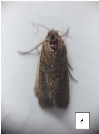
Gambar 4 .(a) Imago jantan (Pembesaran 4X)