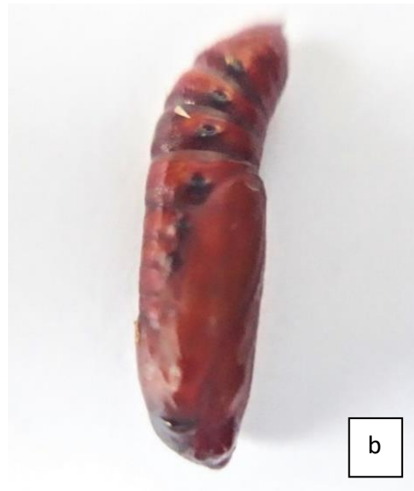
(b) pupa yang akan menjadi imago (Pembesaran 10X)