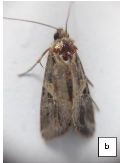
(b) Imago betina (Pembesaran 10X)