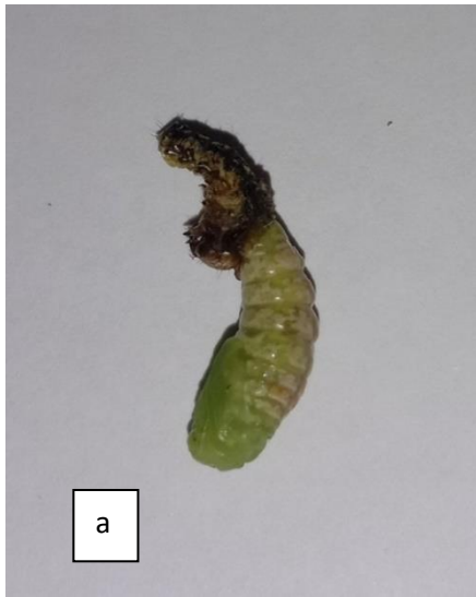
Gambar 3. (a) larva yang baru menjadi pupa (Pembesaran 4X)