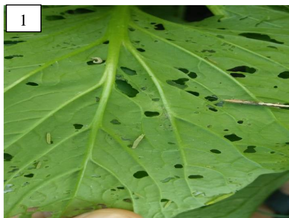
Gambar 1. Gejala Serangan larva Plutella xylostella L.

Berdasarkan hasil sidik ragam menunjukkan bahwa perlakuan berbagai konsentrasi buah maja P 0 Kontrol 0% , P 1 5% , P 2 10%, P 3 20% , P 4 40%, P 5 60%. berpengaruh sangat nyata terhadap populasi larva P. xylostella pada tanaman sawi B. juncea . Hasil rata-rata populasi larva P. xylostella yang menyerang tanaman sawi B. juncea disajikan pada Tabel 2. 10 HST, Tabel 3.16 HST, dan Tabel 4. 22 HST.