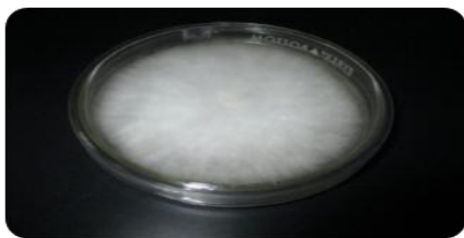
Gambar 1. Biakan Murni A. Porri Pada Media PDA

Hasil analisis keragaman data diameter jamur A. porri menunjukkan perlakuan ekstrak daun sirih pada berbagai konsentrasi berpengaruh nyata dalam menghambat pertumbuhan koloni jamur A. porri pada pengamatan 3-7 hsi. Hasil uji BNT dari rata-rata diameter koloni jamur A. porri dapat dilihat pada tabel 1. Hasil uji BNT (Tabel 1) menunjukkan bahwa pada pengamatan 3-7 hsi, pertumbuhan diameter jamur A. porri kontrol lebih cepat dan berpengaruh nyata dengan semua perlakuan konsentrasi menggunakan ekstrak daun sirih. Begitu pula dengan konsentrasi ekstrak 2%, 4%, 6%, dan 8% masing-masing berpengaruh nyata dengan semua konsentrasi lainnya. Pertumbuhan jamur A. porri paling lambat terjadi pada konsentrasi 8%.