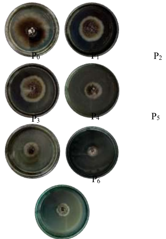
Gambar 2. Koloni C. capsici 7 HSI Konsentrasi (P 0 Kontrol), (P 1 ERL 10%), (P 2 ERL 15%), (P 3 ERJ 10%), (P 4 ERJ 15%), (P 5 ERL 10% : ERJ 15%), (P 6 ERL 15% : ERJ 10%).

dalam menekan pertumbuhan C. Capsici dibandingkan tanpa ekstrak (kontrol).